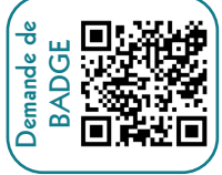
Demande de BADGE