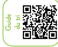
Guide du tri